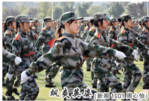
飒爽英姿(新闻1901周心怡)