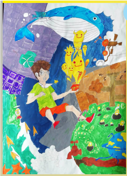
二等奖 商务 1801班 吴富康