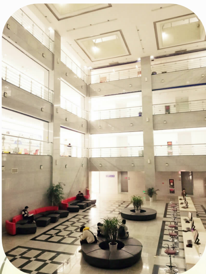
图书馆 一等奖(学生组) 服饰 1801班 周艺