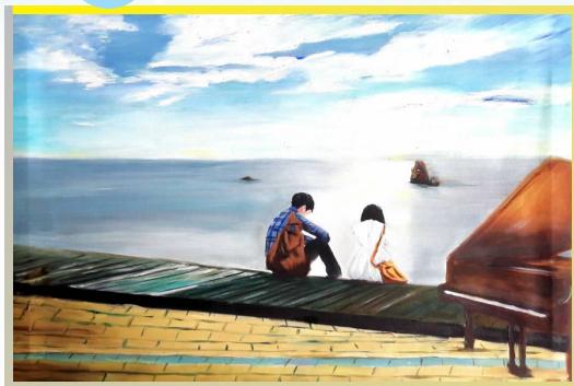
一等奖 网络 1803班 鞠蓁