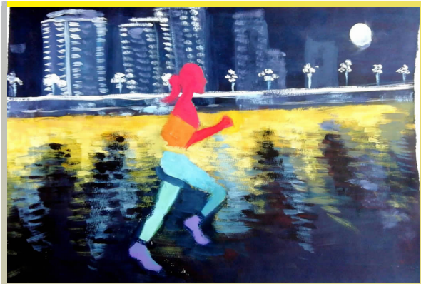
二等奖 视传 1802班 马雨璇