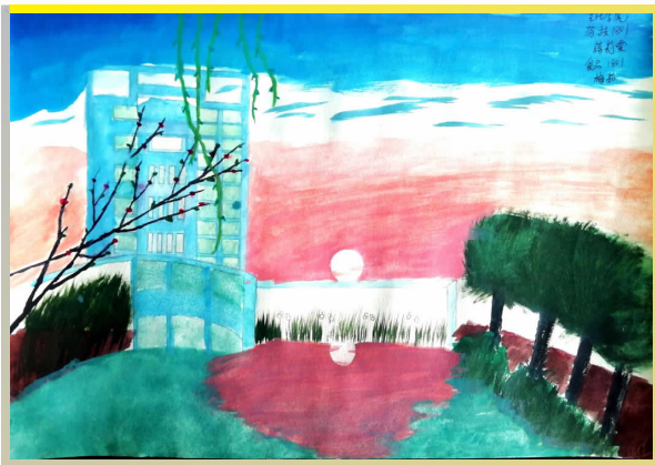
二等奖 药技 1801班 蒋莉雯 食品 1801班 梅茹