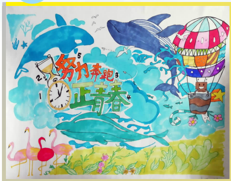
一等奖 风景 1801班 姜娜