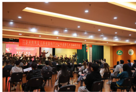
毛泽东》到《北京的金山上》《延安人民热爱毛主席》,一曲曲的民歌联奏,旋律时而舒缓悠扬,时而激昂澎湃,尽显我国广袤大地上不同的文化特色,以及人民对伟大祖国和领袖的热爱。演出过程中艺术家们精

湛的技艺、多变的旋律和独具匠心的编排,感染了在场的每一位观众。一页页乐谱,一段段旋律,一出出起承转合,在几十台乐器和指挥的磨合中渐渐臻于完美。 受疫情影响要求限制,亲临现场的观众人数并不多。但为了更大程度满足全校师生对于美育和人文素养教育的需求,学校创新形式,通过网络平台在线直播的方式,让师生身在教室、宿舍、家中也能欣赏到高水平的音乐演出。 近年来,我校积极承办“高雅艺术进校园”活动。此项活动也成为学校美育教育的重要载体,通过观赏艺术家们精湛的表演,以文化育人,以文育人,坚定文化自信,弘扬民族精神和时代精神。同时也对繁荣校园文化,增强文化育人功能,提升广大学生艺术修养和文化素质发挥了积极的推动作用。