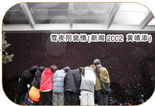
雪夜同窗情(新闻 2002 黄靖添)

这是一座旧戏台,饱经风霜却固执认真地立着,让我们在台上唱遍自己的一生。(文秘 2001 程子桐)