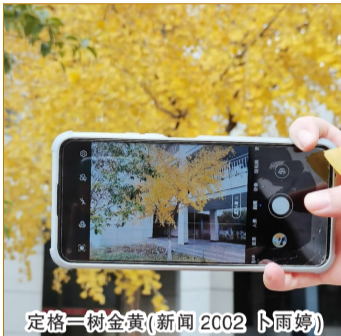
定格一树金黄(新闻 2002 卜雨婷)

我笑你像林妹妹葬花,没有学来风雅,只有矫揉造作。你说:“落叶多美啊,要给它们找到归宿。”风还在吹,有冬天的味道,叶子还在不停落着,天气晴朗,你那里呢,还有落叶吗?(新闻 2002 任紫诺)