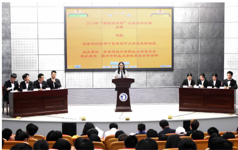
5月29日下午,由校团委主办的2019年“舌战明月湖”大学生辩论赛决赛在映月学术报告厅精彩上演。本届辩论赛历时近40天,来自各学院的20支辩论队参加了比赛。电气学院、管理学院、机械学院、人文学院分获前四名。(刘冰)

在学院初赛遴选的基础上,共有42名教师参加了决赛。决赛现场气氛热烈,参赛教师们从课程标准、教学资源、学情分析、教学程序设计、课程特色等方面将自己的说课方案展现在专家评委面前。评委们认为,本次说课竞赛在教学内容中合理融入课程思政元素,培养学生职业素养;在教学媒体上创新使用“云平台”、“微信公众号”等现代教学信息手段,开展“线上线下”、“课前课中课后”教学;在教学程序设计中有效突出学生积极主动的教学主体地位;在教学资源上努力融合校内外实验实训资源的开发与设计;在学习结果评价中积极采纳学生、教师、行业专家等多元评价方式,关注学生学习过程。竞赛充分展现了我校教师扎实的专业素养、创新的教学思路以及昂扬的精神风貌。