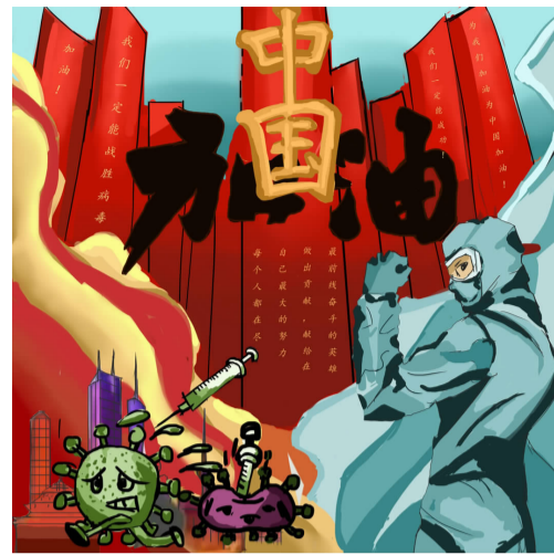
“疫”路有爱,致敬有你 信息工程学院 吴晨霞