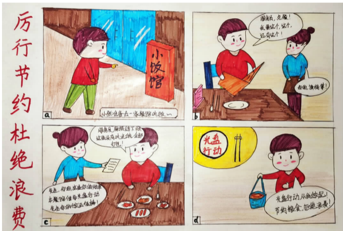
倡导“厉行节约、杜绝浪费”,共建文明校园 国际交流学院 宋若菡